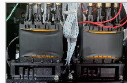
Unidad de calefacción inteligente

La impresora también ofrece opciones de impresión en blanco