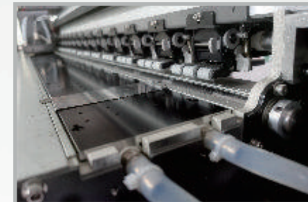
Placa de refrigeración por agua