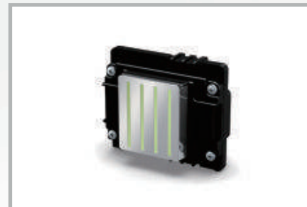
Cabezal Epson I3200 U1