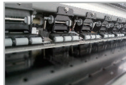
Sistema de paso ajustable