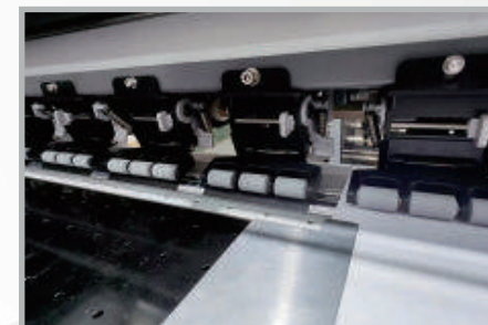
Sistema de pasos preciso y ajustable