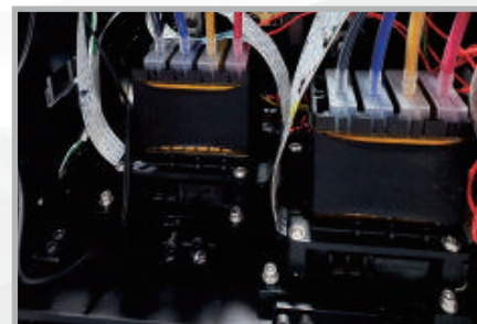
Unidad de calefacción inteligente