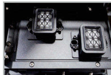
Sistema de limpieza optimizado