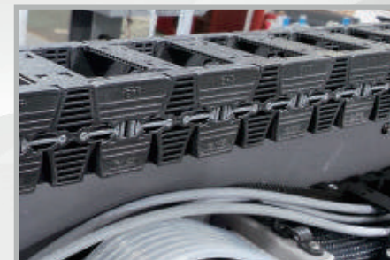
Configuración de gama alta del sistema de movimiento