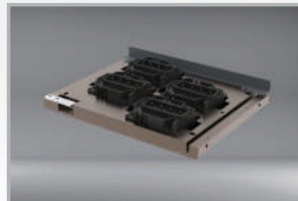
Cabezal Epson I3200 E1