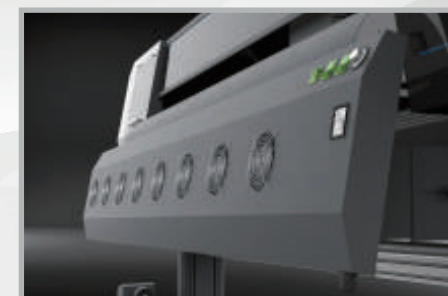
Secador infrarrojo de alta eficiencia