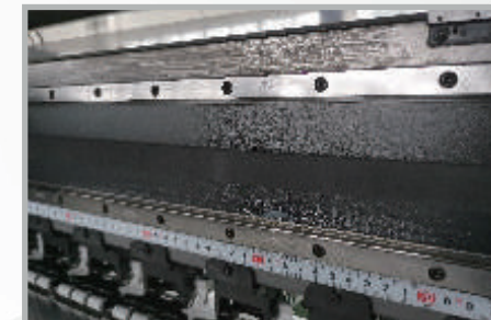
Estructura de alta precisión