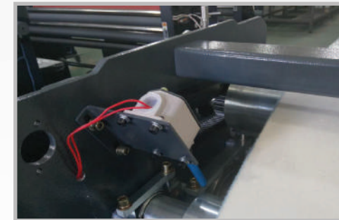
Sensores de tope