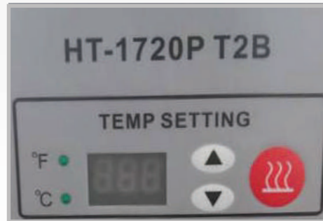
Panel de control