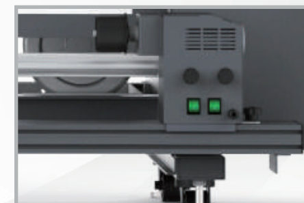
Impresora UV rollo a rollo de alta resistencia