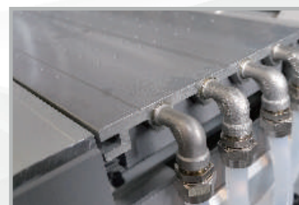
Plato de refrigeración por agua