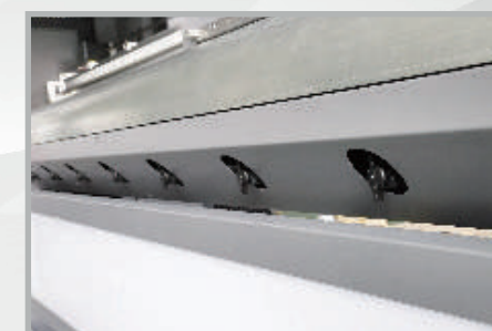
8 zonas de platina de vacío