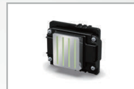
Cabezal Epson I3200 U1